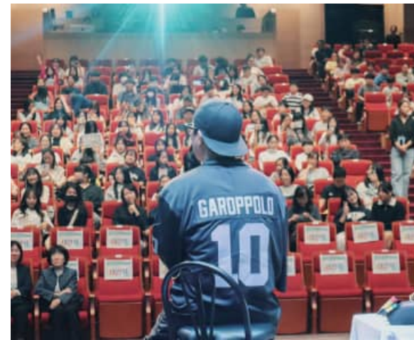
전문 직업인 강연 - 댄서·캐리커처 작가