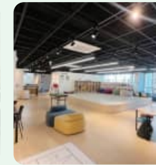
화성시 청소년놀터 [봉담·향남·진안·서연·새솔]